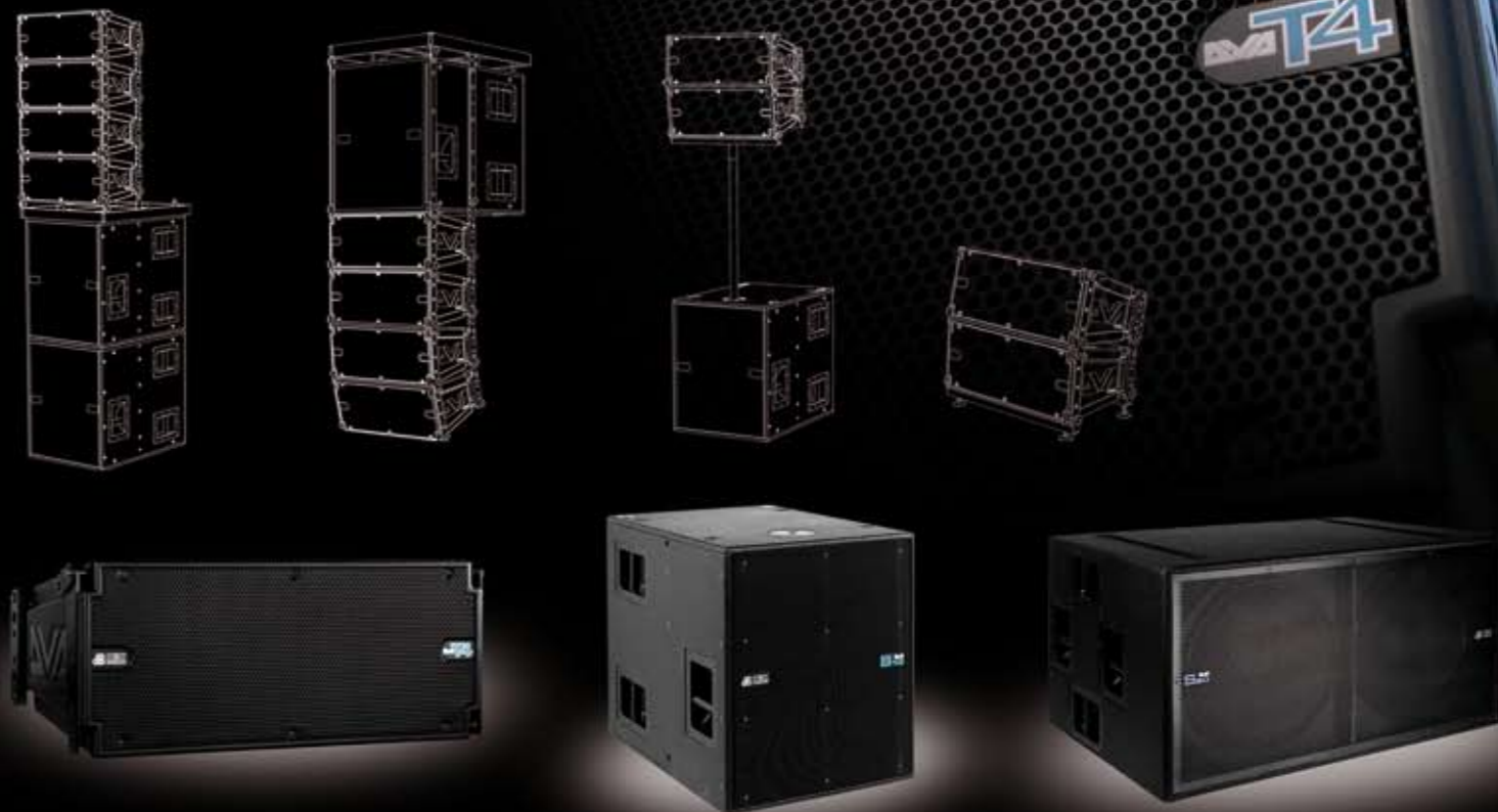
DVA T4 TOP Modulo Line-Array Attivo a 3 vie

DVA (Digital Vertical Array) è un sistema LINE-ARRAY ATTIVO e COMPATTO , destinato all'impiego in luoghi di piccole o medie dimensioni. E' un sistema ECONOMICO e MANEGGEVOLE che offre caratteristiche acustiche eccezionali, ELEVATA POTENZA e FLESSIBILITÀ .