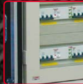
Power Box CEI-EN 60439 17-13/1