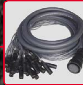
Cavi multipolari Audio

Il tutto è molto divertente per il semplice motivo che Bahauss non ha un sito! ■