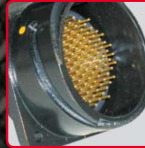
Connettori Multipolari CIR e CIR-LK