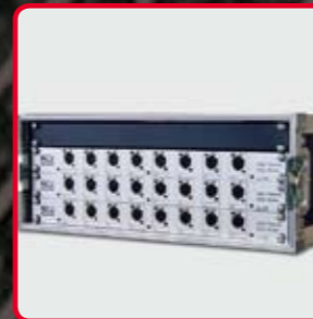
Splitter e Stage Box