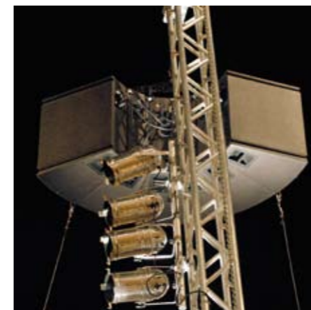
Uno degli array di 6 ARCS

L'impianto audio sembrava progettato apposta per lo Sferisterio, con la sua platea poco profonda ma molto larga e la capienza fino a tremila posti. Si trattava infatti del modello ARCS di L-Acoustics qui applicato in array orizzontale sviluppando un'apertura di oltre 180°, quindi molto adatto a questa particolarissima venue. L'impianto luci era invece abbastanza bizzarro: molti PAR e qualche testa mobile, associati a delle proiezioni video, creavano una suggestiva scenografia luminosa. ■