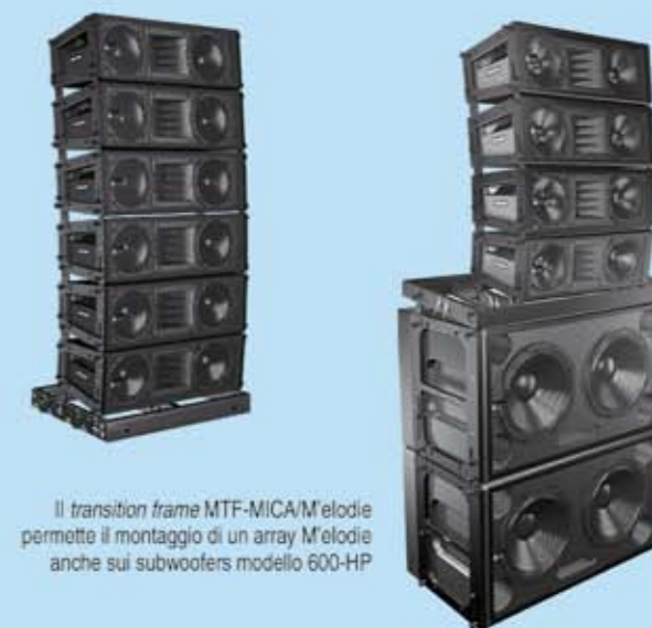
Il transition frame MTF-MICA/M'elodie permette il montaggio di un array M'elodie anche sui subwoofers modello 600-HP

La grande versatilità di M'elodie permette di creare piccoli sistemi montati a terra, che mantengono però tutte le caratteristiche di un line array, o di essere perfettamente integrata in sistemi più ampi come frontfill o down/sidefill di line arrays Meyer Sound MICA e MILO.