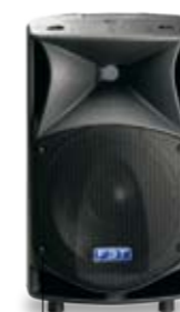
ProMaxX 10a 600+300W ProMaxX 10 400W