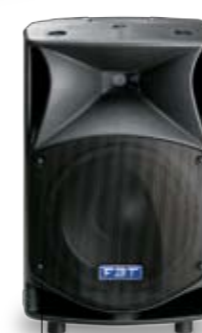
ProMaxX 12a 600+300W ProMaxX 12 600W