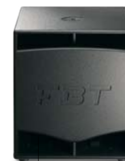
ProMaxX 15Sa 1200W

FBT elettronica SpA 62019 Recanati (MC) - Italy Tel. +39 071 750591 Fax +39 071 7505920