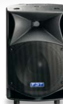
ProMaxX 14a 600+300W ProMaxX 14 700W