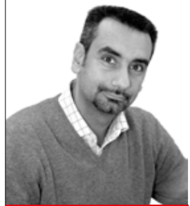
di Giancarlo Messina